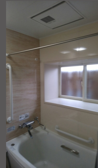
<写真の説明> バリアフリーの入口になって寒さ対策でサッシもペアガラスになりました。